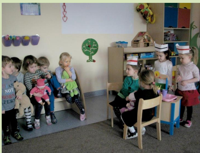
W gabinecie lekarskim - zabawa tematyczna.

Z mamą Asi, która jest astronomem poznajemy planety.